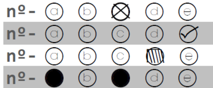
Figura 03 - preenchimento INCORRETO;