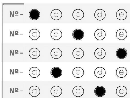
figura 02 - preenchimento CORRETO de cartão-resposta Ensino Médio